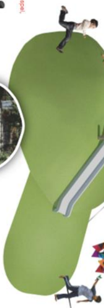
6. Toftebalk Plus Klimmen, glijden en rollenspel, wat een leuk toetsel!