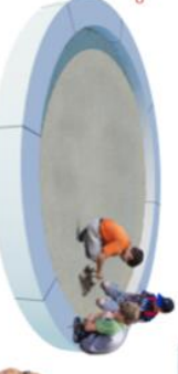
11. Zandbak 8 3m Bak jij ook lekkere koekjes op deze brede zandstrand?