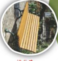
10. Bankjes Lekker even uitrusten en toefjeven!