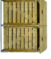
12. Klimwand aan muur Kom jij zonder te vallen naar de andere kant?